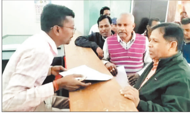
कलेक्टर के नाम एसडीएम को ज्ञापन सौंपते अधिवक्ता संघ के पदाधिकारी।

जिसका आज तक कोई कार्यवाही नहीं हो सका है जिसके कारण पुनः अधिवक्ता संघ ने लैलूंगा के द्वारा अपनी छः सूत्रीय मांगों को लेकर रायगढ़ जिले के सनेदनशील कलेक्टर को अवगत कराते हुए ज्ञापन सौपा गया है जिसमें मुख्य मांगें तहसील न्यायालय लैलूंगा में अधिवक्तागण नोटरीगण एवं पक्षकारों के लिए कोई बैठक व्यवस्था नहीं होने के कारण ग्राम पंचायत कुजारा द्वारा निर्मित साईकिल स्टैंड में